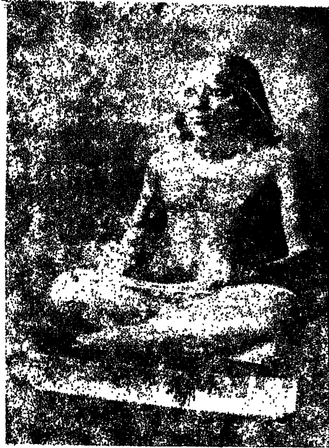
تمثال يدبغ من الحجر الجيري الملون يمثل كاتباً متريعا ، وعلى ركبتيه ملك منشور. من البردى - سقارة ، الأسرة (٤) • ( محفوظة بالمتحف المصري )